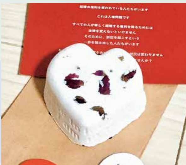
石鹸会社LUSHとのコラボ石鹸

本年11月30日には、東京地方裁判所で東京第一次訴訟の判決が言い渡されます。判決言い渡し後にはリアルとオンラインでの期日報告会も予定されています。是非注視していただければと思います。